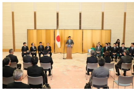
首相官邸にて行われた表彰式の様子

茶産地育成事業(新産地事業)、茶殻リサイクルシステムなどを通じ、 パートナーシップを重視したSDGsの推進に取り組む企業として表彰。